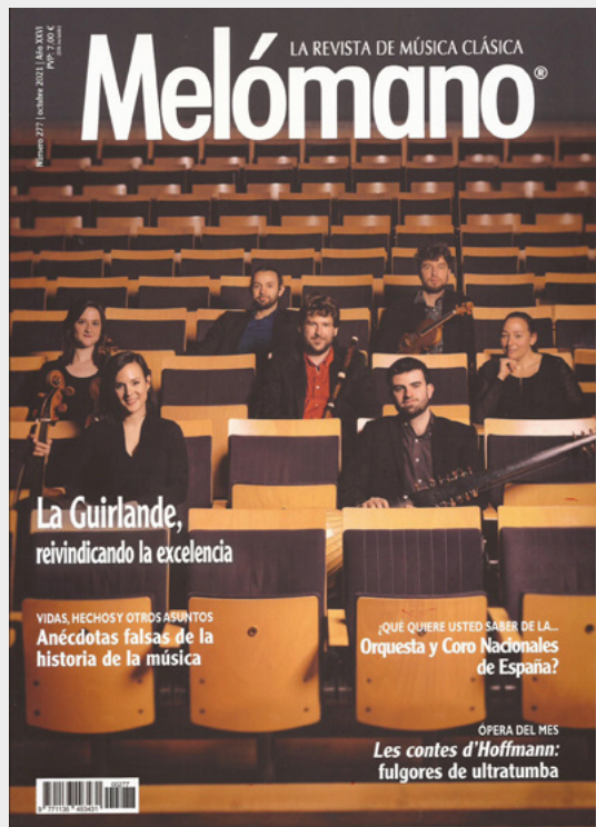
La Guirlande auf dem Cover des Melómano-Magazins, Oktober 2021