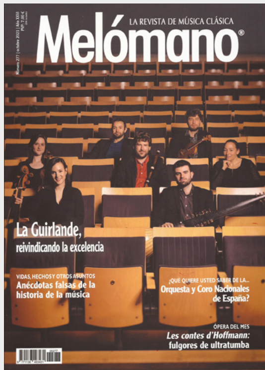
La Guirlande auf dem Cover des Melómano-Magazins, Oktober 2021