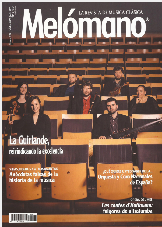
La Guirlande Portada de la revista Melómano. Octubre 2021